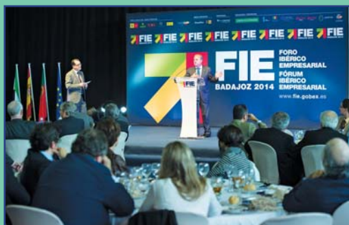
II Foro Ibérico Empresarial.

Otro de los elementos claves que acercaron a los territorios y a sus poblaciones fue