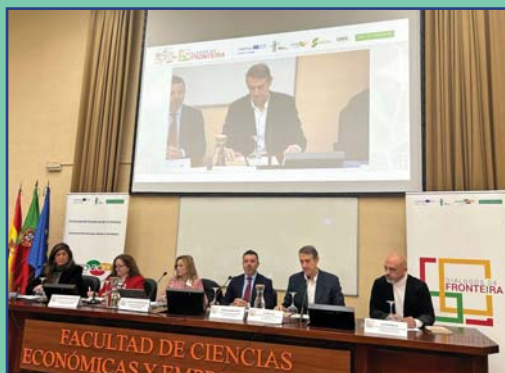
Diálogo de Frontera. Trabajo Transfronterizo: Realidades y retos.

vecinos, nuestras programaciones culturales intercambian músicas, artes y literaturas, nuestros servicios públicos esenciales mantienen contactos continuados para colaborar en asuntos medioambientales, climáticos, sanitarios o de seguridad que no entienden de rayas en los mapas.