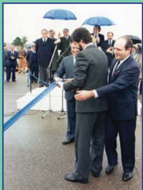
El vicepresidente de la Comisión Europea, Manuel Marín, y los Comisarios Abel Matutes y António Cardoso, durante el acto simbólico de supresión de la aduana hispano-lusa.

Se cumplen 40 años desde la entrada de España y Portugal en la Comunidad Económica Europea. Ambos países habían vivido bajo dos dictaduras durante buena parte del siglo XX, habían pasado dos procesos de transición democrática con peculiaridades diferentes y en mitad de los años 80 se encontraban en las mejores circunstancias para integrarse plenamente en Europa y convertirse, además, en dos de los países más europeístas del continente.