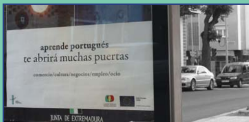
Imagen de la campaña publicitaria lanzada por el GIT para promover el aprendizaje de la lengua portuguesa.

eurorregión, donde es el propio tejido social quien se encarga de buscar sus alianzas y colaboraciones con organizaciones homólogas del otro lado de la Raya.