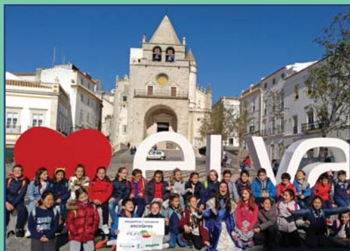
Encuentro escolar del alumnado del CEIP Santa Marina de Badajoz y el Agrupamento de Escolas S. Sancho II de Elvas.

Extremadura y las regiones vecinas de Centro y Alentejo han convertido aquellos 428 km de frontera que obstaculizaban en un espacio en el que ya no hay límites, en el que no hay que detenerse porque nuestra ciudadanía europea nos permite compartir y obtener beneficios mutuos. En una Europa compuesta por 27 países con trayectorias, lenguas y culturas distintas, la cooperación transfronteriza ha sido y es también una forma de reconciliación, un ejercicio diario de entendimiento. En nuestras escuelas e institutos se aprende la lengua de nuestros