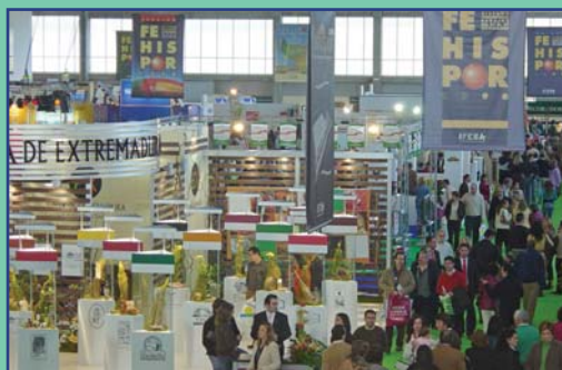
Celebración de Fehispor en las nuevas instalaciones de IFEBA, construida con fondos Interreg.

El 21 de septiembre de 2009 se firmó en la localidad de Vila Velha de Ródão el convenio de constitución de la eurorregión EU-ROACE y se inició una nueva fase en la cooperación que Alentejo, la Región Centro de Portugal y Extremadura habían comenzado a principios de la década de los noventa. El balance de la cooperación iba ampliando sus áreas de acción través de proyectos conjuntos destinados a desarrollar de manera integral las riberas de nuestros grandes ríos fronterizos, a interconectar a los principales centros de investigación de cada región, a impulsar la competitividad de las empresas o a proteger la fauna y los singulares paisajes de dehesas compartidas.