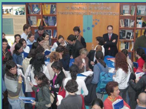
Aspecto general del stand del Gabinete de Iniciativas Transfronterizas en la inauguración de Ágora, el debate peninsular

Esta Oficina de Extremadura en Lisboa, que desde 2012 está ubicada en la propia Embajada de España en Lisboa, impulsa la cooperación institucional con Portugal, manteniendo una interlocución con instituciones portuguesas y con organismos españoles presentes en la capital lusa. Asimismo, se encarga de asesorar a la administración autonómica en sus relaciones con el país vecino, de difundir y promocionar la imagen de Extremadura, de realizar el seguimiento de asuntos relevantes para la región y de prestar apoyo en la organización de visitas, actos y reuniones oficiales de representantes extremeños en Portugal.